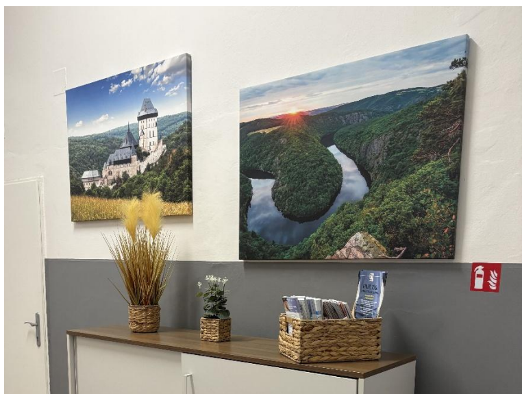
Obrazy na chodbě lůžkového oddělení Onkologické kliniky 1. LF UK a FTN (pavilon A3, 2. patro).