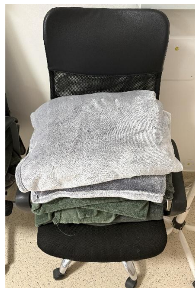
Krycí nástěnná deska k pracovní lince na stacionář, A3, 2.p. Fleecové plédy na denním stacionáři.