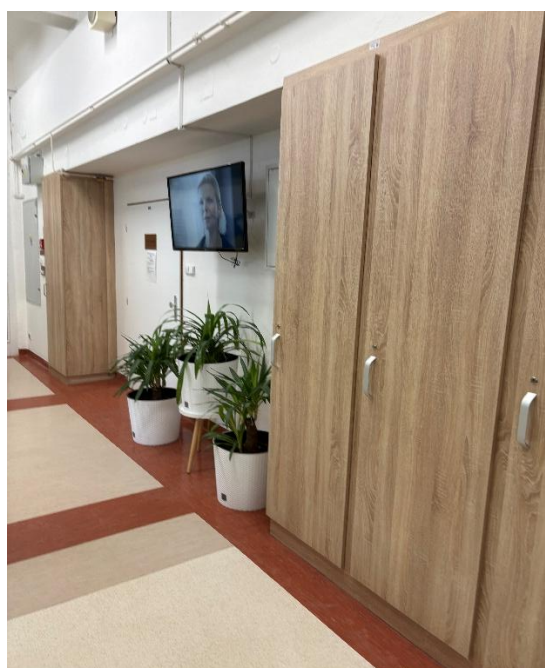
Záclona a květiny na schodišti pavilonu A3. Vestavěné skříně v čekárně stacionáře (A3, 2.p.).