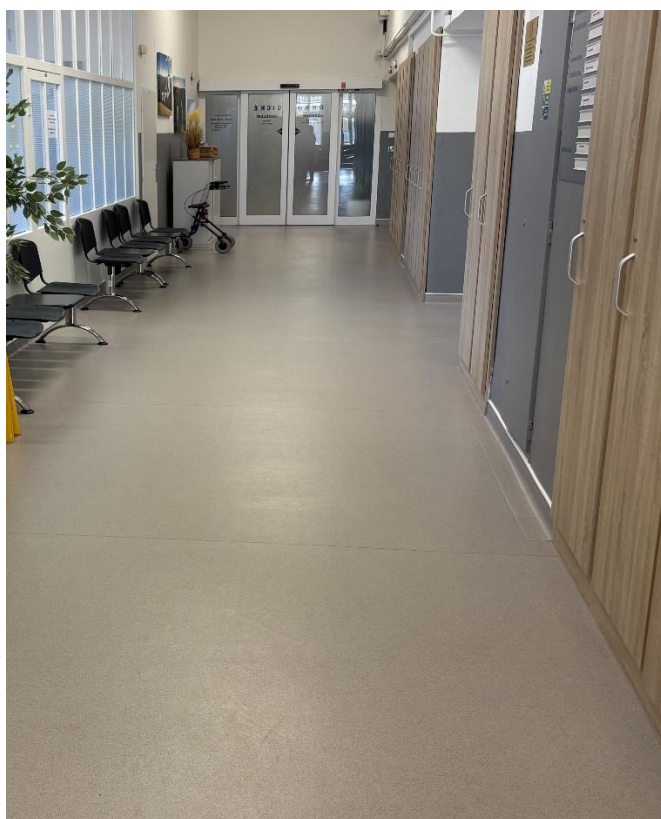
Zrenovovaná podlaha na lůžkovém onkologickém oddělení (pavilon A3, 2. patro).