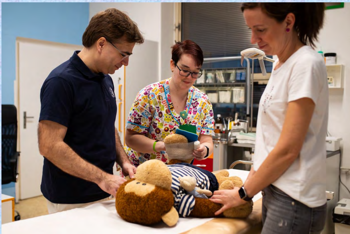
Sestřička nožičku zavázala, aby to tolik nebolelo, a pak je zavedla na lůžkové oddělení.