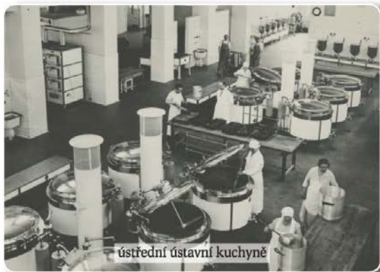
ústřední ústavní kuchyně

Masarykovy domovy byly stavěny do značné míry i jako nemocnice, byly vybaveny jako nemocnice, technicky velmi moderně zařizeny, s lékařskou službou vykonávanou LF UK. Bylo přirozené, že se nemocnicí nakonec staly. Smutnou