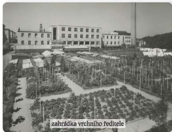
zahradka vrchního ředitele

Protože zakladatelé již při plánování stavby mysleli dopředu na možné změny, zaopatřovací ústavy, postavené původně jako moderní chudobinec a chorobinec, měly od začátku dostatečné technické předpoklady k tomu, aby se staly nemocnicí. V roce 1947 poskytla správa města na pět let dva pavilony pro filiálky nemocnice na Bulovce: