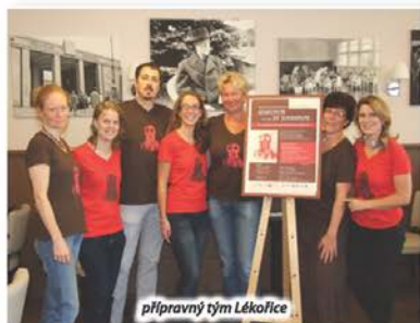
přípravný tým Lékořice

Výstava a další akce k 85. výročí otevření Masarykových domovů