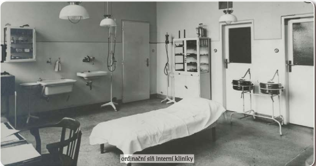
ordinační síň interní kliniky