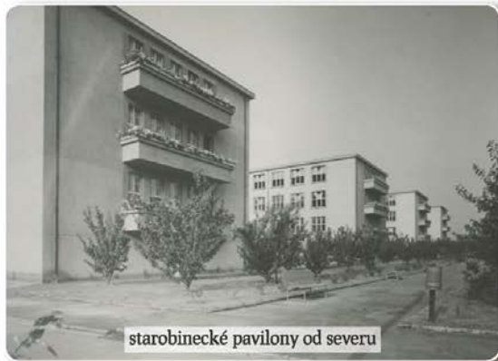
starobinecké pavilony od severu

Před konečným rozhodnutím byla vyžádána stanoviska a rady nejenom u nás ale i v zahraničí. V létě 1924 byla pro-