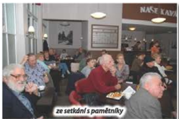
ze setkání s pamětníky