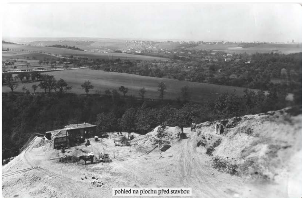
pohled na plochu před stavbou

Před 90. lety se rozhodli představitelé města Prahy pro velkorosý projekt řešení sociální péče v hlavním městě předválečné ČSR. Jednalo se o neobvyklou stavbu, která neměla v Evropě obdoby. Šlo také o realizaci nové koncepce sociální péče. Péče o bezmocné byla od josefinských dob úkolem státu. Od 60. let 19. století pak zákonem převedena na obce. Bezmocní byli nejen sirotci, starci a stařeny, ale také veřejné nemocnice nesměly přijímat nevyčísitelně choré. Takže i chronicky nemocní pacienti s tuberkulózním nebo onkologickým onemocněním, kardiaci, revmatici, diabetici a další, potřebovali pomoc. Pokud oni sami, ani jiné povinné osoby nebyli způsobilé opatřit jim prostředky potřebné k životu, staraly se o ně domovské obce podle tzv. domovské příslušnosti. Ty tak činily podle svých finančních možností. Ústavů bylo málo a i v nich zpravidla jenom několik míst. Problém chudiny se nejčastěji řešil povolením žebroty. Pražská obec nebyla v době vzniku Československa v jednoduché situaci. Když se v r. 1922 k 8 městským částem připojilo 37 sousedních obcí, zvýšil se počet obyvatel trojnásobně, na téměř tři čtvrtě miliónu. Praze patřila 11. příčka mezi nejlidnatějšími městy Evropy. Povinnost připadající velké Praze, jako domovské obci, postarat se o potřebné, nabyla nové dimenze. Zadatelů, kteří měli na chudinské zaopatření ze zákona nárok, přibývalo, míst pro ně naopak ubývalo. V nově připojených obcích sice