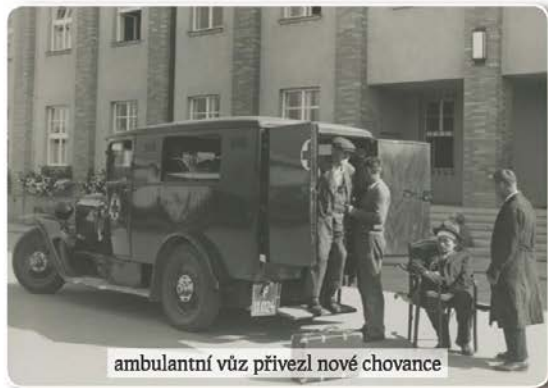
ambulanci přivezl nové chovance

V anonymní soutěži konané 28. května 1925 „U Primasů“ posuzovala devítičlenná porota pět projektů pojmenovaných „Továrna na pohádky“, „L“, „Senectuti et iuventuti“, „DO“ a „Slunce“. Zvítězil projekt „Senectuti et iuventuti“