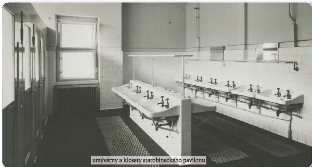
umývárny a klosety starobineckého pavilonu

Přistavěla se karanténa – izolační pavilon pro děti, internát pro ošetřovatelky, a protože nápor žadatelů ochotných a schopných si pobyt platit stoupal, přistoupilo se koncem 30. let i ke stavbě pavilonu pro platící chovance – tzv. Baxova pavilonu.