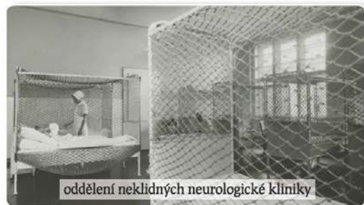
oddělení neklidných neurologické kliniky