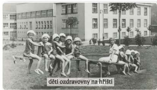
děti ozdravovny na hřišti

Veřejně prospěšná práce chovanců se předpokládala samozřejmě. Podle chudinského zákona mohla obec žádat i bezplatnou práci. Prozatímní ideový plán zaopatřovacích ústavů