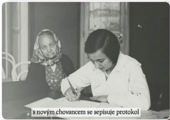
s novým chovancem se sepisuje protokol

Od začátku se počítalo s tím, že podle potřeby bude ústav postupně rozšiřován a dostavován. Už v roce 1931 se zvětšil počet lůžek, a to tím způsobem, „že z pokojů o osmi lůžkách budou pokoje desetilůžkové, eventuálně devítilůžkové atd., čímž získají starobince 295 nových lůžek, chorobince 71 nových míst“.