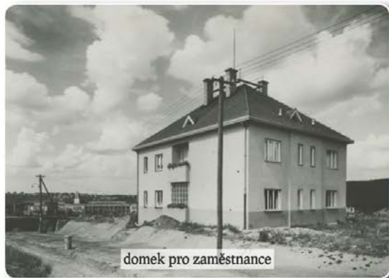
domek pro zaměstnance