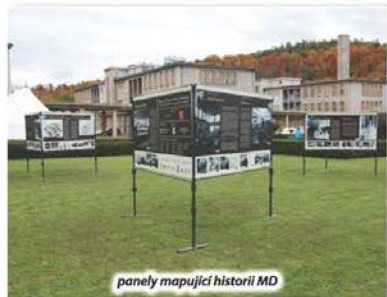
panely mapující historii MD

ředitele by uvítali, kdyby nemocnice mohla mít nový slušivý kabát a stát se tak jako před 85. lety výstavním architektonickým počinem. Bohužel reálné možnosti financování oprav budov jsou pod silným tlakem ze strany památkové ochrany, která se na celý areál vztahuje a je bohužel v tomto ohledu poněkud kontraproduktivní.