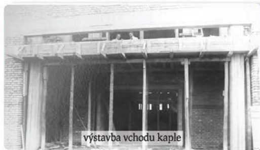
výstavba vchodu kaple