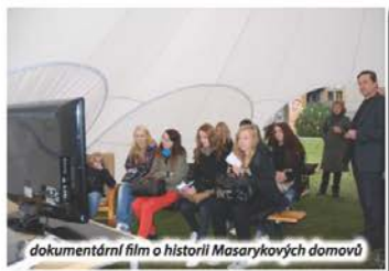
dokumentární film o historii Masarykových domovů