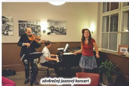
závěrečný jazzový koncert

Celý den se nesl v příjemné lidsky pospolitě a téměř slavnostní náladě. „ Proč to máte jen na dva dny? A nebudete to opakovat? To je škoda... “ To byly nejčastější výtky ze strany návštěvníků. Pravda, někteří měli tendenci spustit obvyklý kolotoč stesků nad situací dnes, láteřit na politiku a poměry. Ty jsme zdvořile požádali, aby si zkusili výstavu užívat, pokorně smeknout před umem našich předků a třeba se sami pro sebe a budoucnost inspirovat.