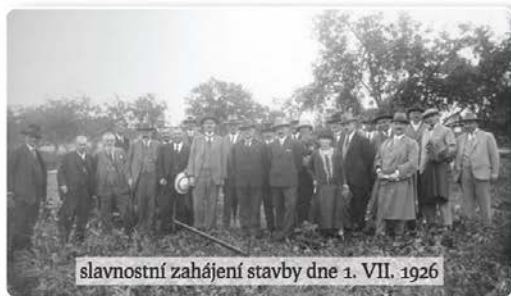
slavnostní zahájení stavby dne 1. VII. 1926

Před 90. lety se rozhodli představitelé města Prahy pro velkorosý projekt řešení sociální péče v hlavním městě předválečné ČSR. Jednalo se o neobvyklou stavbu, která neměla v Evropě obdoby. Šlo také o realizaci nové koncepce sociální péče. Péče o bezmocné byla od josefinských dob úkolem státu. Od 60. let 19. století pak zákonem převedena na obce. Bezmocní byli nejen sirotci, starci a stařeny, ale také veřejné nemocnice nesměly přijímat nevyčísitelně choré. Takže i chronicky nemocní pacienti s tuberkulózním nebo onkologickým onemocněním, kardiaci, revmatici, diabetici a další, potřebovali pomoc. Pokud oni sami, ani jiné povinné osoby nebyli způsobilé opatřit jim prostředky potřebné k životu, staraly se o ně domovské obce podle tzv. domovské příslušnosti. Ty tak činily podle svých finančních možností. Ústavů bylo málo a i v nich zpravidla jenom několik míst. Problém chudiny se nejčastěji řešil povolením žebroty. Pražská obec nebyla v době vzniku Československa v jednoduché situaci. Když se v r. 1922 k 8 městským částem připojilo 37 sousedních obcí, zvýšil se počet obyvatel trojnásobně, na téměř tři čtvrtě miliónu. Praze patřila 11. příčka mezi nejlidnatějšími městy Evropy. Povinnost připadající velké Praze, jako domovské obci, postarat se o potřebné, nabyla nové dimenze. Zadatelů, kteří měli na chudinské zaopatření ze zákona nárok, přibývalo, míst pro ně naopak ubývalo. V nově připojených obcích sice