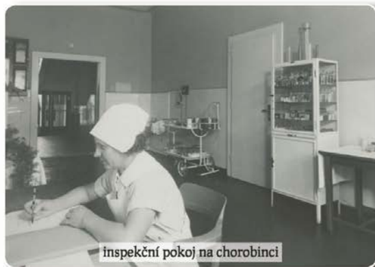
inspekční pokoj na chorobinci

a ke kterým patřily ambulance, ordinace i operační sály. Dále zde byly tři dětské ústavy, dětská zotavovna pro 200 dětí školou povinných, dětský chorobinec pro 150 nevléčitelných dětí a epileptiky a dětská ozdravovna pro nejnižší věkové skupiny, a to od kojenců po děti do 6 let. Ostatní budovy správní, společenské i hospodářské byly vybaveny nejmodernějším zařízením a spolu s pavilony sociálně zdravotní složky umístěné v rámci parkového náměstí přístupného po kolonádách, tvořily provozně a funkčně soběstačný celek. Jejich uspořádání a technické vybavení bylo moderní, účelné a ekonomické. Například kotelná byla na svou dobu neuvěřitelně automatizovaná, vybavená dokonalou měřicí technikou, kde pracoviště topičů působilo dojmem laboratoře. Na stejné vysoké úrovni byly i ústřední prádelna, kuchyně a její sklady potravin, vlastní pekárna a řeznictví. Rozvoz potravin po areálu byl zajišťován nehluknými elektrickými vozíky firmy Křížik neznečišťujícími ovzduší. Zahradnictví se skleníky a rozsáhlé sady dodávaly čerstvou zeleninu