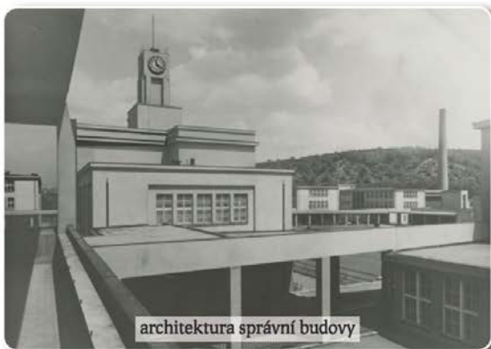
architektura správní budovy

dvě možnosti jak nahradit chybějící místa ve starobincích a chudobincích. Buďto obnovit staré a dostavět nové malé ústavy tam, kde se jich nedostávalo, nebo postavit jeden ústřední ústav pro celou Prahu. Pro první variantu mluvily zkušenosti a tradice, druhá měla řadu odpůrců. Předsedou Ústředního sociálního sboru byl národní socialista Petr Zenkl, zkušený politik a pracovník v sociální oblasti, pozdější primátor města Prahy, přesvědčený o tom, že sociální péče není dobročinností, ale povinností společnosti. Právě on se stal iniciátorem rozhodnutí jít originální a náročnější druhou cestou a tvůrcem ideového programu pražského ústředního zaopatřovacího ústavu. Pro jedinou a velkou stavbu argumentoval ekonomickými, medicínskými a sociálními důvody. V tzv. investičním programu hlavního města Prahy na 50 let rozvoje, schváleném 16. června 1924, byl už projekt ústředního zaopatřovacího ústavu zahrnut. Petr Zenkl řekl v této souvislosti o sociální péči slova,