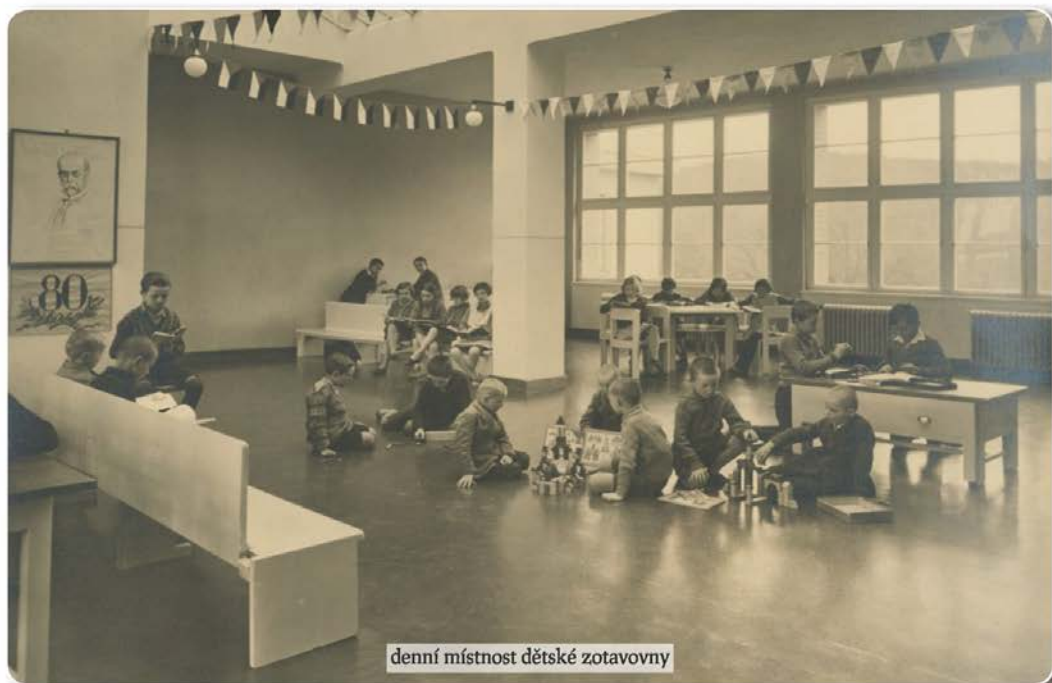
denní místnost dětské zotavovny

chovancům od 8 do 10 a od 13 do 15, chovankám pak od 10 do 12 a od 15 do 17 hodin. Posléze usneseno zakázati donášení piva a alkoholických nápojů na pavilony chorobinecké a prodej chovancům chorobinců v kantýně."