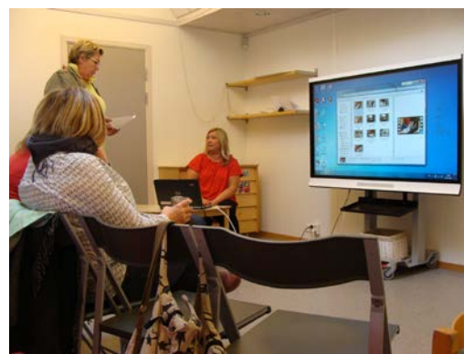
Terapeutka prezentuje terapii dítěte, supervizorka poskytuje zpětnou vazbu

Druhý den jsme v další školce byly přítomny terapii dalšího čtyřletého chlapce s atypickým autismem, s velkou slovní zásobou, ale bez porozumění. Bylo skvělé vidět ABA terapeutky v přímé práci s dětmi a velmi jsme ocenily praxi, kdy jsou do péče o dítě vtaženi odborníci, ale i rodiče, čímž se stává terapie mnohem efektivnější, protože jednotný přístup používají všichni, kteří o dítě pečují.