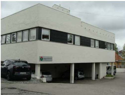
Kapellveien Habilitation Center v Oslu

Navázání bilaterální spolupráce a výměna zkušeností se zaměřením na terapeutické aktivity při práci s dětmi v rámci projektu NF-CZ11-OV-2-024-2015