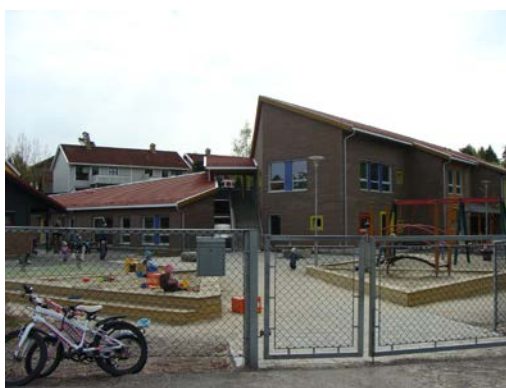
Mateřská školka v Åsgårdstrand

stanovení diagnózy až po práci terapeutického týmu odpovědného za konkrétní dítě (rodiče, psychodiagnostik, osobní asistent z MŠ, terapeut, supervizor, později i učitel v ZŠ). Byly jsme přítomny terapii tříletého chlapce s vysoko funkčním autismem. Vzhledem k tomu, že veškeré terapie jsou natáčeny pro pozdější analýzu, následoval z videozáznamu monitoring efektivity terapie tohoto dítěte od loňského roku až do současnosti. Odpoledne následovala účast na terapii čtyřletého chlapce s PAS, s přiměřenými dovednostmi a znalostmi, ale s minimálními sociálními dovednostmi. Na závěr jsme se opět sešly s vedoucími k vyhodnocení naší stáže a k diskusi; probíráno bylo srovnání českého a norského systému péče, diagnostické metody, ale i možné příčiny PAS.